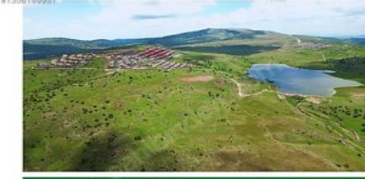
ANKARA BEYPAZARI KARAŞAR 1650 RAKIM' da YAYLA BÖLGESİNDE BULUNAN PARSELLERİMİZ İMARLI İFRAZLIDIR 18 UYGULAMASI YAPILMIŞTIR BÖLGE' de 5 FARKLI İMAR UYGULAMASI MEVCUTTUR.