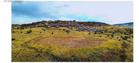
ANKARA BEYPAZARI KARAŞAR BÖLGEDE PLANLANAN PROJELER MEVCUTTUR BÖLGENİN OYUN KURUCUSU TABİR ETTİĞİMİZ OSB TÜRK FİRMASINA AİTTİR.