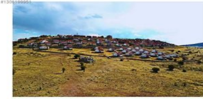
ANKARA BEYPAZARI KARAŞAR BÖLGE' de YAKLAŞIK OLARAK 200 İLA 250 ADET VİLLA MEVCUTTUR