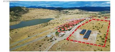
ANKARA BEYPAZARI KARAŞAR KARTALTEPE VİLLA PROJESİ 1.ETAP dan OLUŞMAKTA 1 ETAP TAMAMLANDI TOPLAM 40 ADET VİLLA YAPILACAK