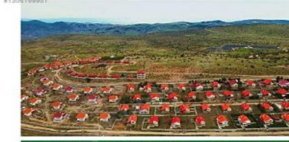
ANKARA BEYPAZARI KARAŞAR % 5 % 10 BAĞ BAHÇE HOBİ BAHÇESİ