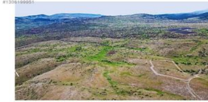
ANKARA BEYPAZARI KARAŞAR BJK ve PANELLERİN OLDUĞU ALAN 3.ŞEREFİYE BÖLGESİ