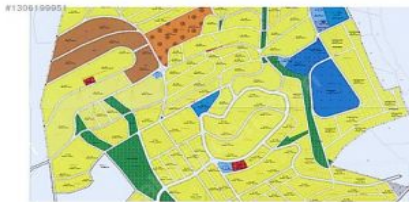
ANKARA BEYPAZARI KARAŞAR BÖLGENİN MASTER PLANI TAMAMLANMIŞTIR SOSYAL DONATILAR YAŞAM ALANLARININ YERLERİ BELİRLENMİŞTİR.