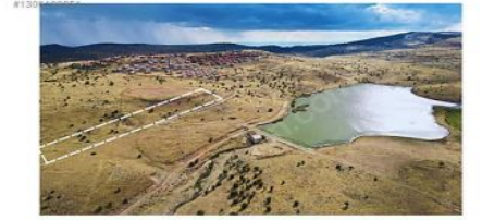
ANKARA BEYPAZARI KARAŞAR GÖL KENARI GÖL MANZARALI 1.ŞEREFİYE BÖLGESİ