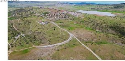
ANKARA BEYPAZARI KARAŞAR YAPILARIN ve GÖLÜN ARA NOKTASI 2.ŞEREFİYE BÖLGESİ