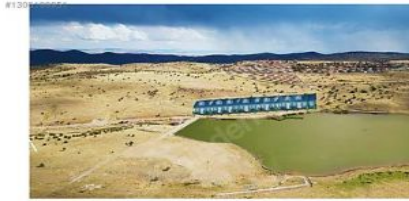
ANKARA BEYPAZARI KARAŞAR KARTALTEPE DAİRE PROJESİ GÖL KENARINA YAPILACAKTIR