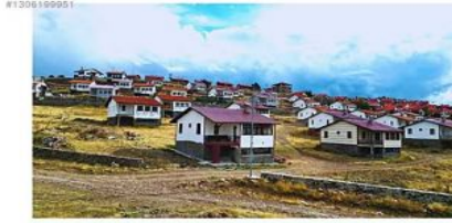
ANKARA BEYPAZARI KARAŞAR BÖLGE ŞEREFİYE OLARAK 3 AYRI BÖLÜMDEN OLUŞMAKTA