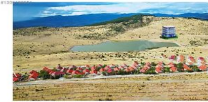
ANKARA BEYPAZARI KARAŞAR AİLTON GARDEN OTEL PROJESİ GÖLÜN KARŞI TARAFINA YAPILACAKTIR