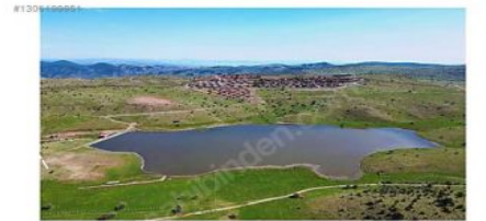
ANKARA BEYPAZARI KARAŞAR 1650 RAKIMIN EN BÜYÜK AVANTAJI HAVA ORANIDIR BÖLGEDE KUA ve AKCIĞER HASTALARI TEDAVİ AMAÇLI KALMAKTA DİR.