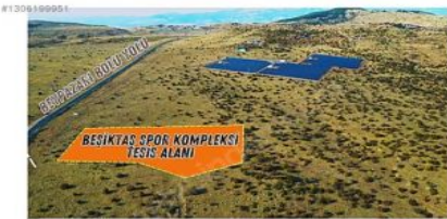
ANKARA BEYPAZARI KARAŞAR BEŞİKTAŞ SPOR KLÜBÜNE AİT ARAZİ OSB TÜRK TARAFINDAN HİBE EDİLMİŞTİR. ANTEREMAN TESİSLERİ YAPILMASI ŞARTI İLE