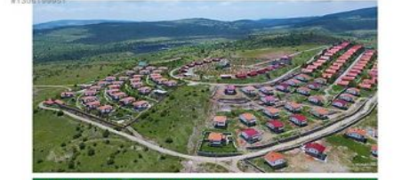
ANKARA BEYPAZARI KARAŞAR % 25 % 50 % 70 2 KAT 4 KAT 4 KAT