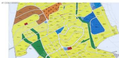
ANKARA BEYPAZARI KARAŞAR BÖLGENİN MASTER PLANI TAMAMLANMIŞTIR SOSYAL DONATILAR YAŞAM ALANLARININ YERLERİ BELİRLENMİŞTİR.