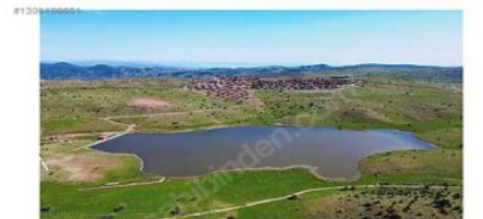
ANKARA BEYPAZARI KARAŞAR 1650 RAKIMIN EN BÜYÜK AVANTAJI HAVA ORANIDIR BÖLGEDE KUA ve AKCIĞER HASTALARI TEDAVİ AMAÇLI KALMAKTA DİR.