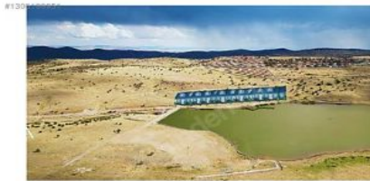
ANKARA BEYPAZARI KARAŞAR KARTALTEPE DAİRE PROJESİ GÖL KENARINA YAPILACAKTIR