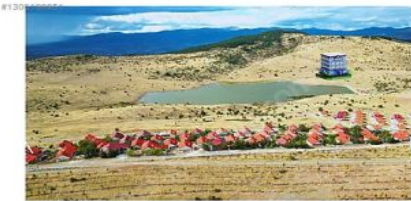
ANKARA BEYPAZARI KARAŞAR AİLTON GARDEN OTEL PROJESİ GÖLÜN KARŞI TARAFINA YAPILACAKTIR