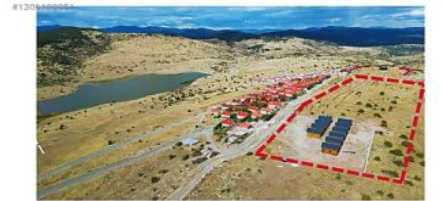
ANKARA BEYPAZARI KARAŞAR KARTALTEPE VİLLA PROJESİ 1.ETAP dan OLUŞMAKTA 1 ETAP TAMAMLANDI TOPLAM 40 ADET VİLLA YAPILACAK