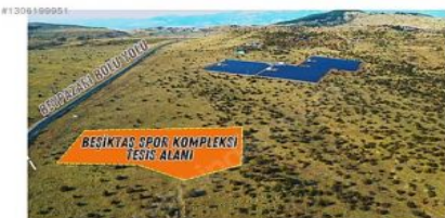
ANKARA BEYPAZARI KARAŞAR BEŞİKTAŞ SPOR KLÜBÜNE AİT ARAZİ OSB TÜRK TARAFINDAN HİBE EDİLMİŞTİR. ANTEREMAN TESİSLERİ YAPILMASI ŞARTI İLE